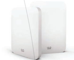
Meraki MS LAN Inalámbrica