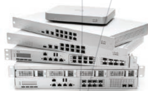
Meraki MX Dispositivos de Seguridad