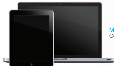
Meraki SM Gestión de Dispositivos Móviles