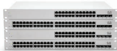
Meraki MS Switches Ethernet